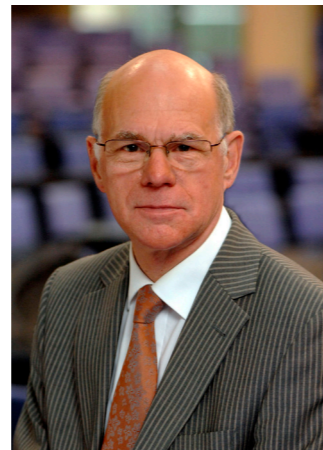
Prof. Dr. Norbert Lammert Präsident des Deutschen Bundestages

Bei der Juniorwahl parallel zur Bundestagswahl bekommt auch Ihr die Möglichkeit, Demokratie ganz praktisch zu erleben und zu üben, sogar vor Erreichen des Wahlalters. Denn am 22. September 2013 findet die Wahl für den Deutschen Bundestag der 18. Wahlperiode statt. An diesem Tag werden die Wählerinnen und Wähler unseres Landes von ihrem Stimmrecht Gebrauch machen und über das politische Kräfteverhältnis der nächsten Jahre im Bund entscheiden können. Diese Wahl ist ein